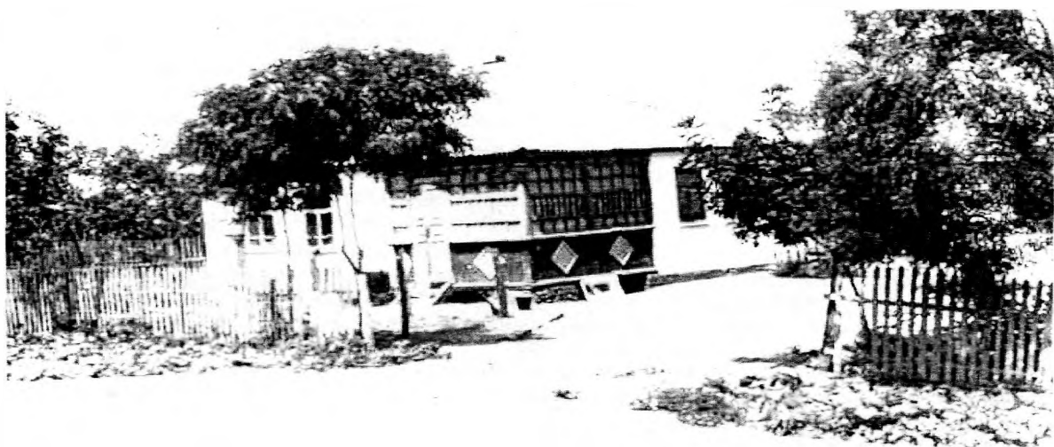
Жилище переселенца в с. Теречное. 1967г.