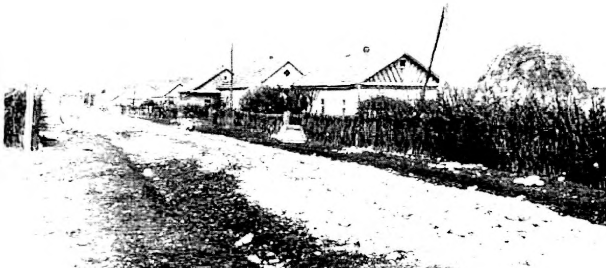
Переселенческое селение Теречное в Хасавюртовском районе. 1967г.