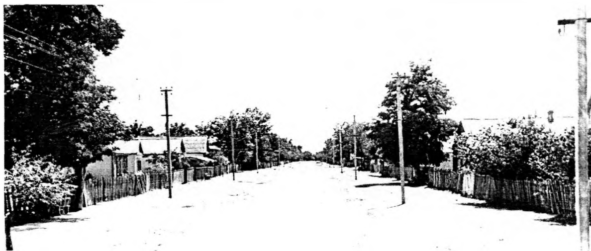
Переселенческое селение Ново-Филя в Магарамкентском районе. 1967г.