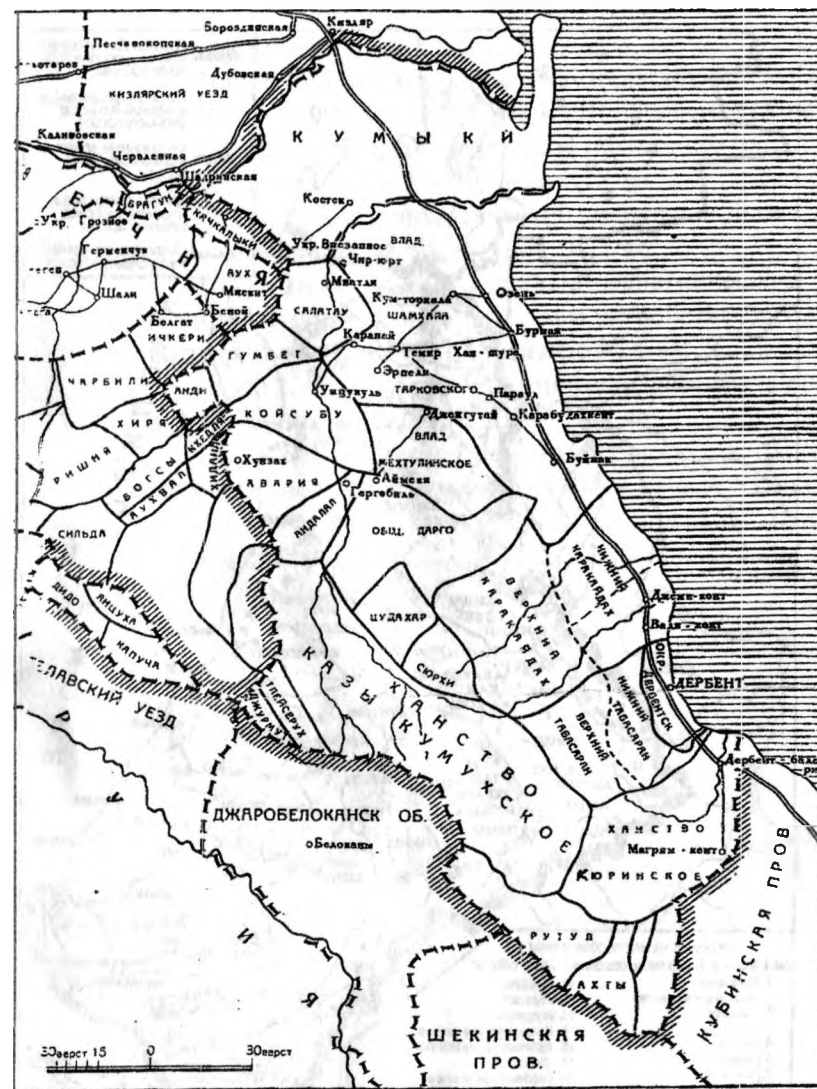
Политическая карта Дагестана (40-е годы XIX в.). (Из «Карты политического состояния Кавказа»)