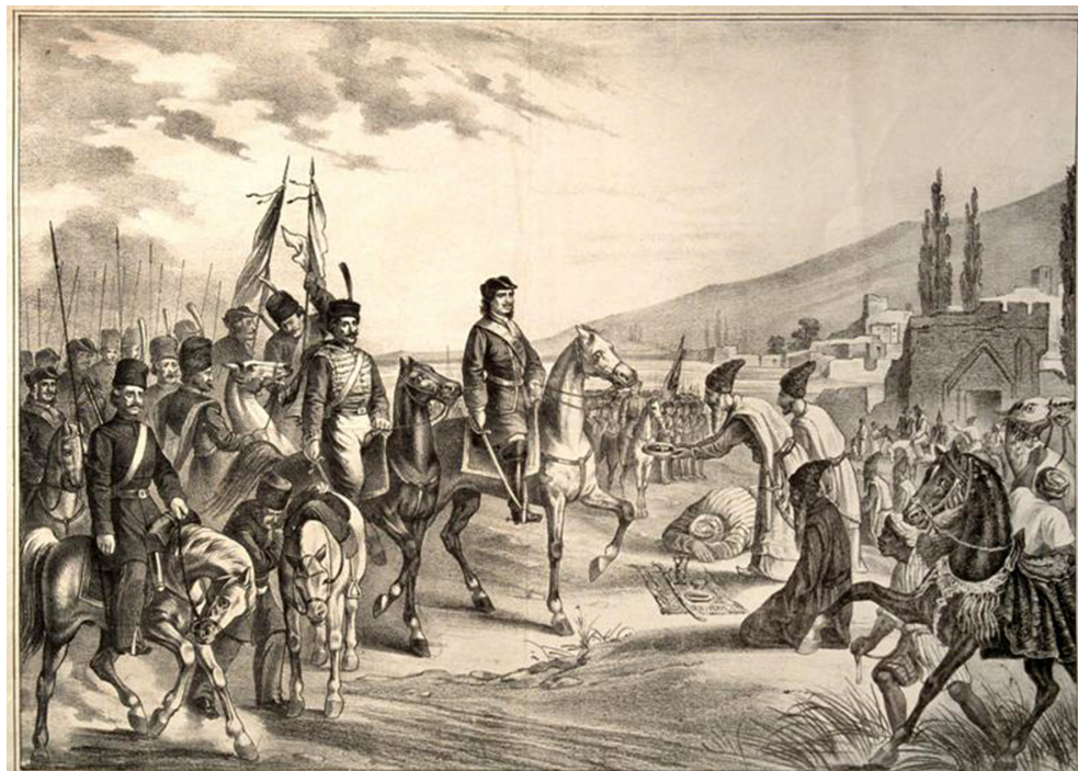
Ил. 1. Взятие крепости Дербент. Литография А. Абрамова, 1872 г.