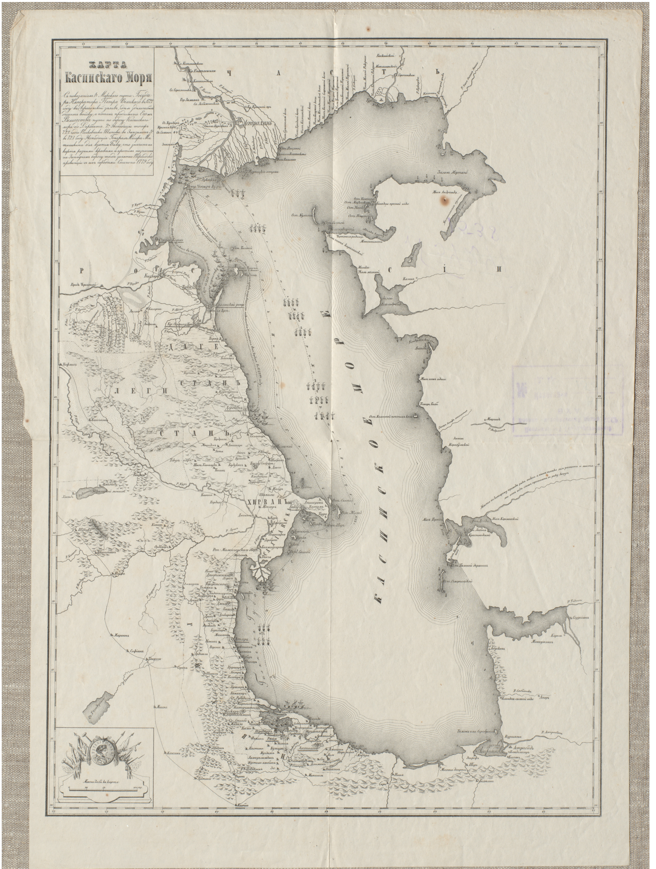
Ил. 9. «Карта Каспійскаго моря» с указанием пути следования императора Петра Великаго в Дербентъ в 1722 г.