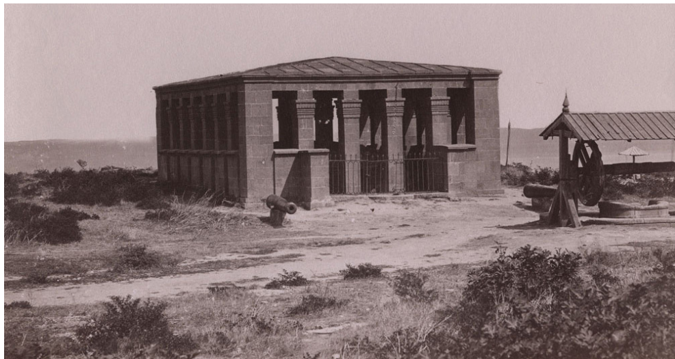
Ил. 3. Домик Петра I. конец XIX в.