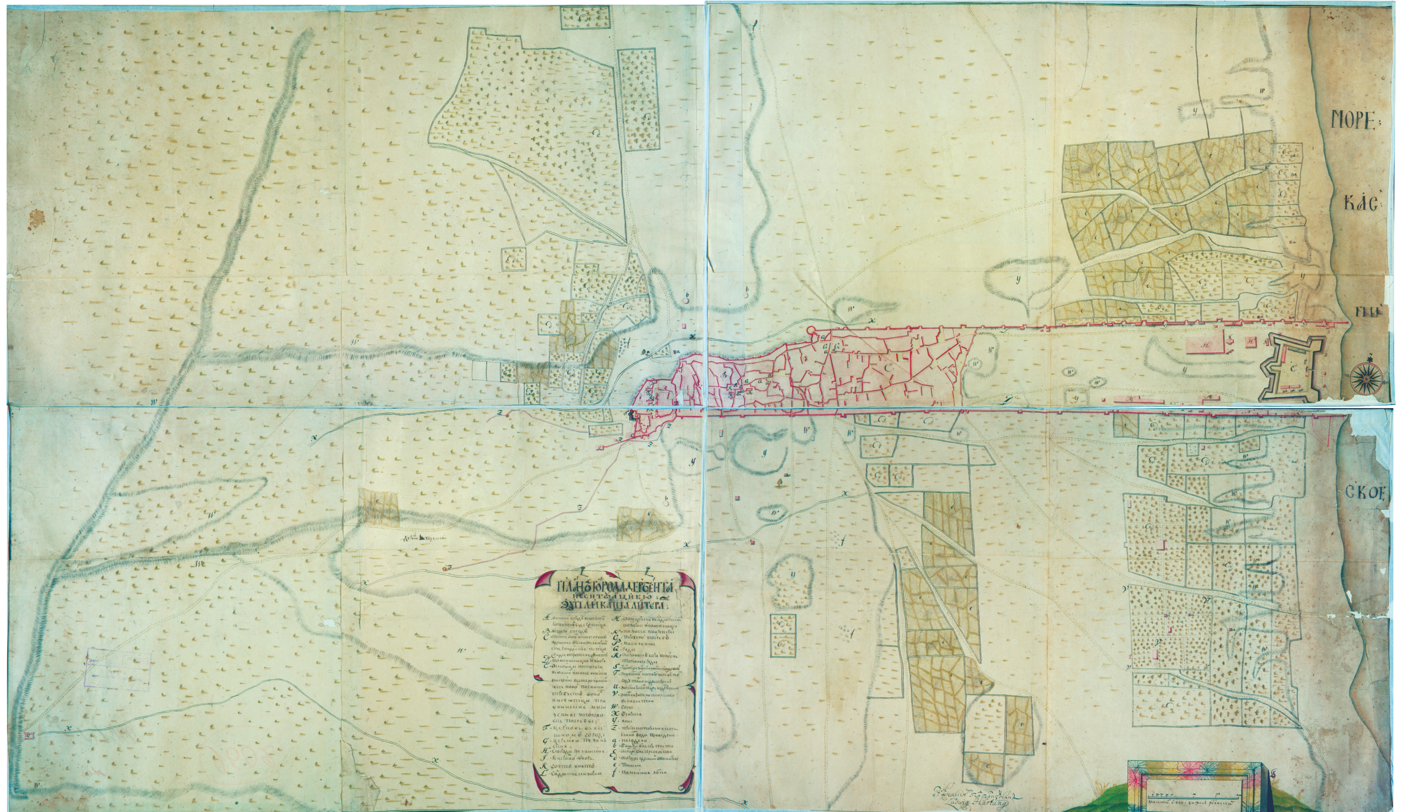
Ил. 8. «План города Дербента и с ситуациею» инженера-подполковника Л. Гартунга.