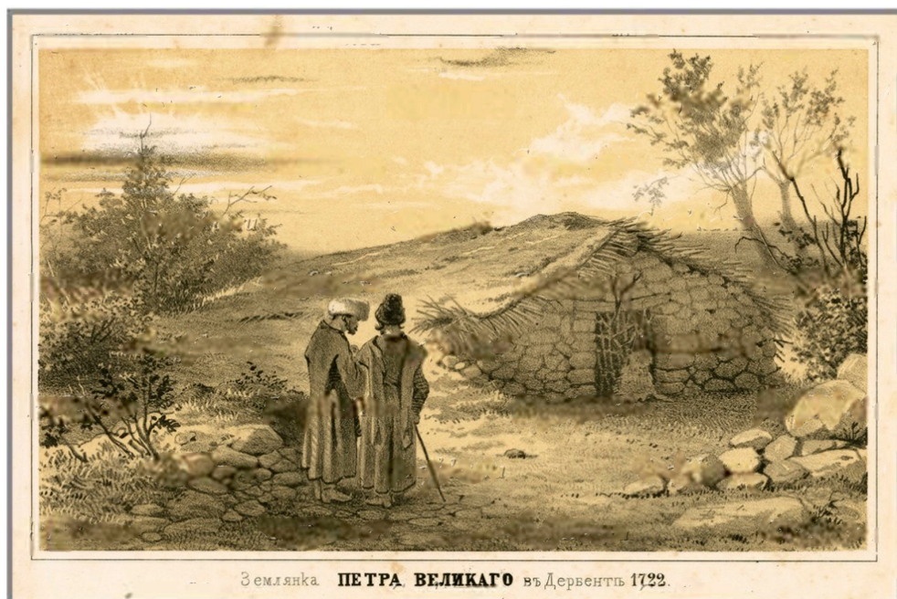
Землянка ПЕТРА ВЕЛИКАГО въ Дербентѣ 1722.